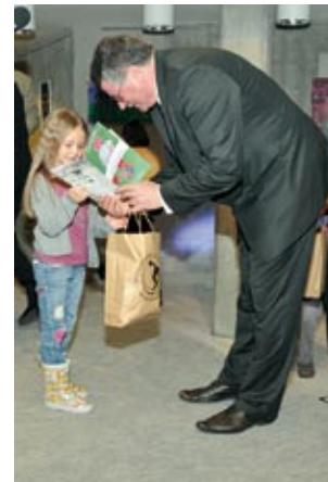
Najmłodsze laureatki Konkursu plastycznego odbierają nagrody.