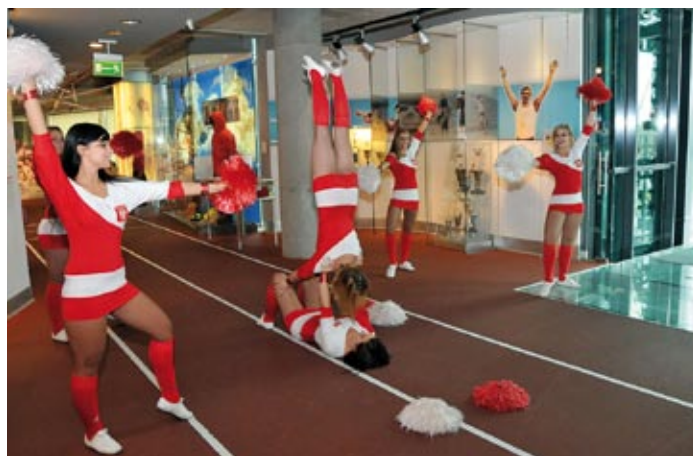
Rozstrzygnięciu Konkursu towarzyszył występ zespołu cheerleaderek Bell Arto .