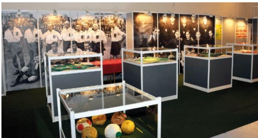
Gabloty z eksponatami piłkarskimi na wystawie w Muzeum Techniki.