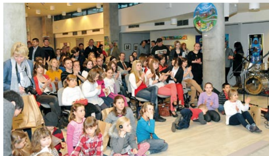
Publiczność wernisażu wystawy „Piłka nożna na poważnie i wesoło”.