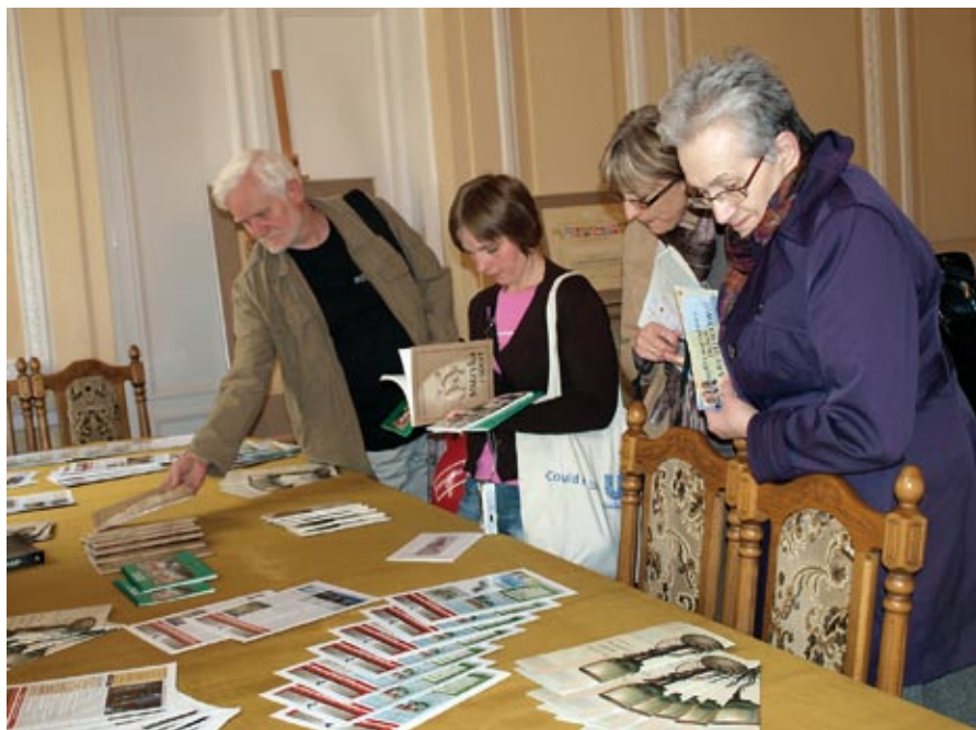
Wydawnictwa naszego Muzeum cieszyły się powodzeniem wśród gości Pikniku Archiwalnego.

Szczególnym zainteresowaniem cieszyły się stroje reprezentacji Polski z lat 50. XX wieku oraz z Mundialu 2006 r., buty piłkarskie z lat 40. XX wieku i współ-