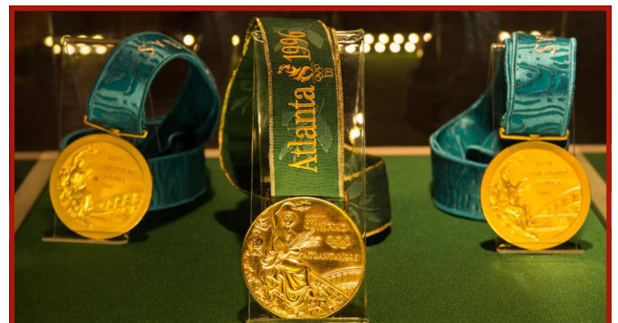
W MSiT można oglądać trzy z czterech złotych medali olimpijskich Roberta Korzeniowskiego

W Atlancie Robert Korzeniowski rozpoczął „złoty szlak”. Na kolejnych IO w Sydney (2000) i Atenach (2004) wywalczył jeszcze trzy medale z najcenniejszego kruszcu i stał się jedynym Polakiem, który czterokrotnie został mistrzem olimpijskim. Zdobył także trzy tytuły mistrza świata i dwa mistrza Europy.